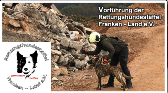
Vorführung der Rettungshundestaffel Franken - Land e.V.

Für die Kleinen: Nikolaus, Schmieden, Kerzenziehen, Fotoecke, Stockbrot, Märchentante, Kinderchor, Tiere hautnah erleben!